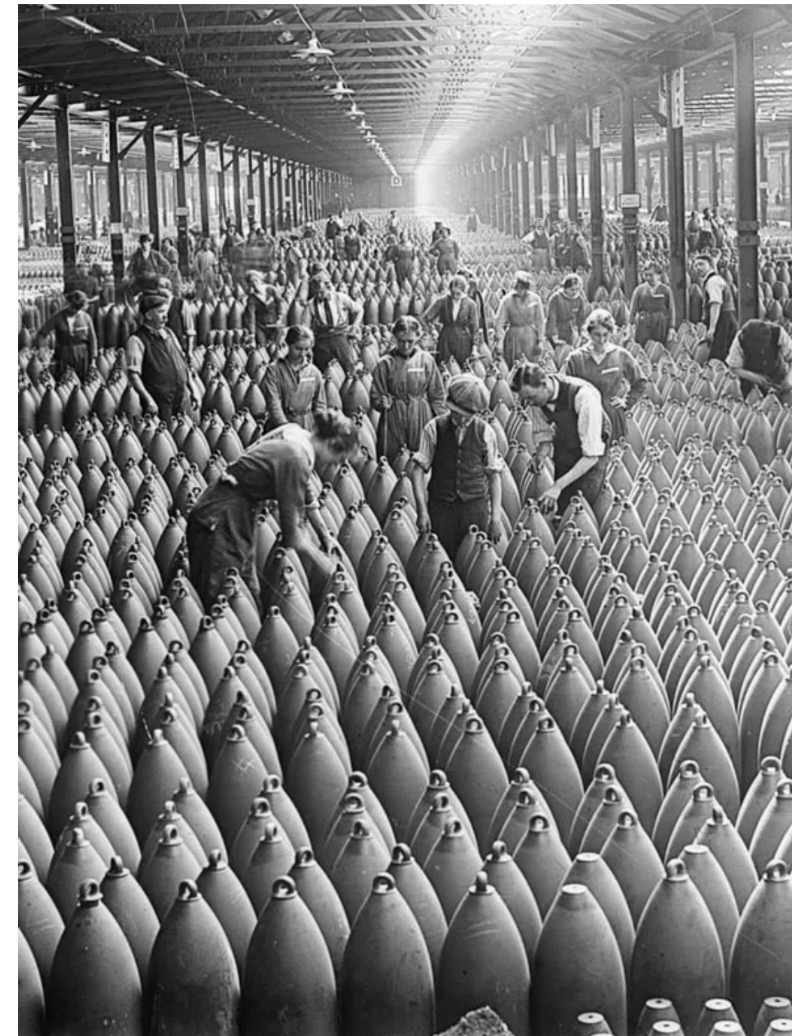
TRABALHADORES EM UMA FÁBRICA DE BOMBAS NA INGLATERRA