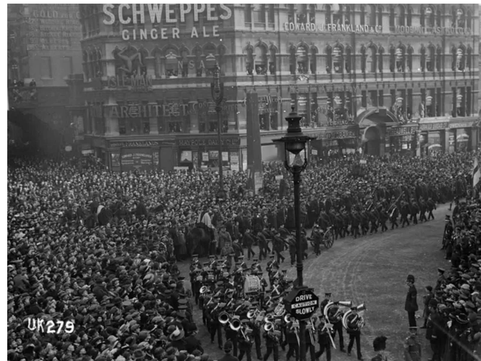
TROPAS MARCHAM EM LONDRES APÓS ASSINATURA DE ARMISTÍCIO QUE DEU FIM À GUERRA, EM 1918

→ Em junho de 1919, é assinado o Tratado de Versalhes , que impôs as condições de paz – as mais duras para a Alemanha. O país perdeu todas as suas colônias, foi desarmado, teve parte de seu território ocupado militarmente e ainda precisou pagar uma pesada indenização pelos custos da guerra.