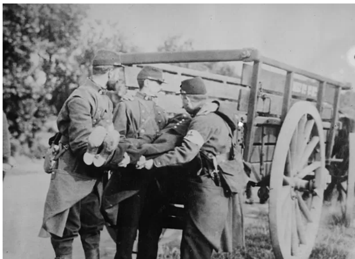
SOLDADOS FRANCESES RECOLHEM FERIDO EM CIDADE DA BÉLGICA, EM 1914

→ Foi o período mais sangrento da guerra, onde as batalhas duravam semanas ou até meses, com a perda e retomada de posições e um saldo grande de "baixas" para ambas as partes.