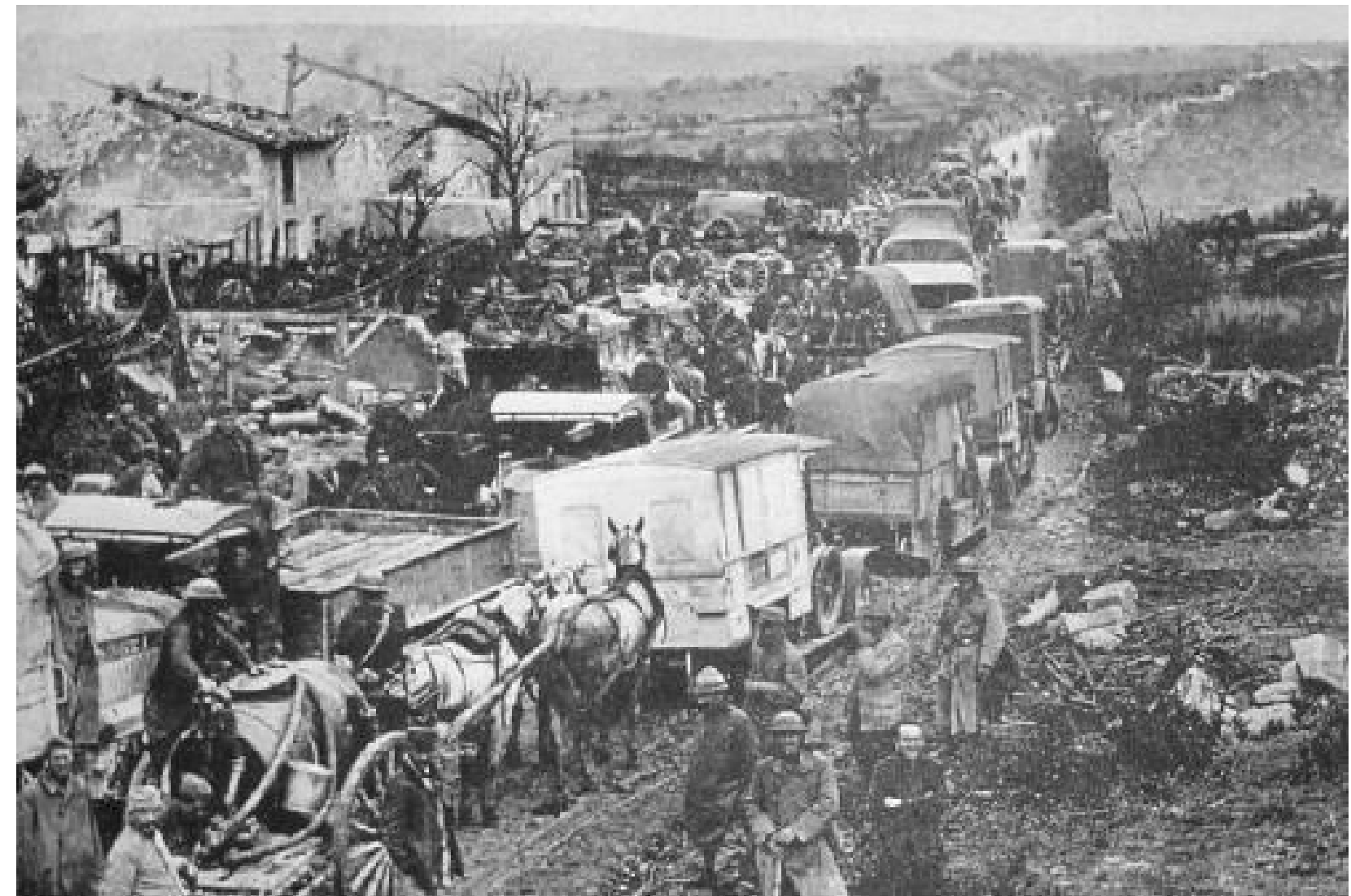
ATAQUES UTILIZANDO A CAVALARIA