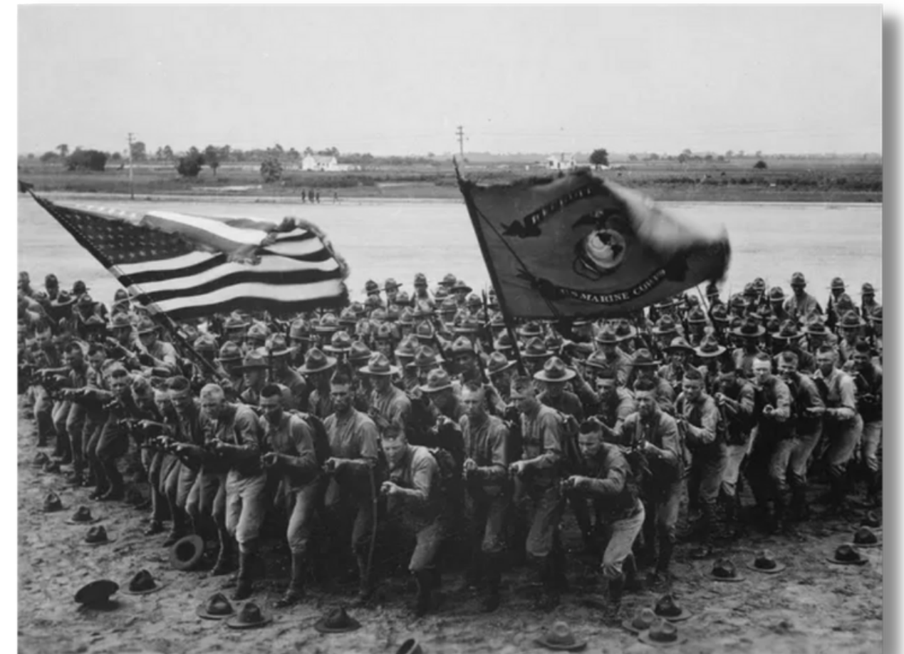
SOLDADOS AMERICANOS EM MATERIAL DE PUBLICIDADE DE RECRUTAMENTO