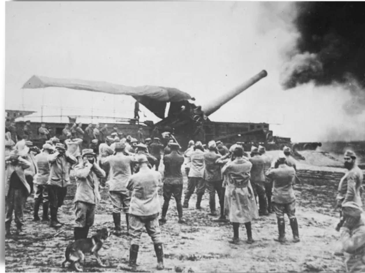
EXÉRCITO FRANCÊS FAZ DISPARO COM IMENSO CANHÃO DE GUERRA

→ Os exércitos passaram a usar metralhadoras, frotas de encouraçados, submarinos, tanques de guerra, lança-chamas e gases tóxicos. Os aviões, que antes serviam apenas para observação, começaram a ser usados em bombardeios.