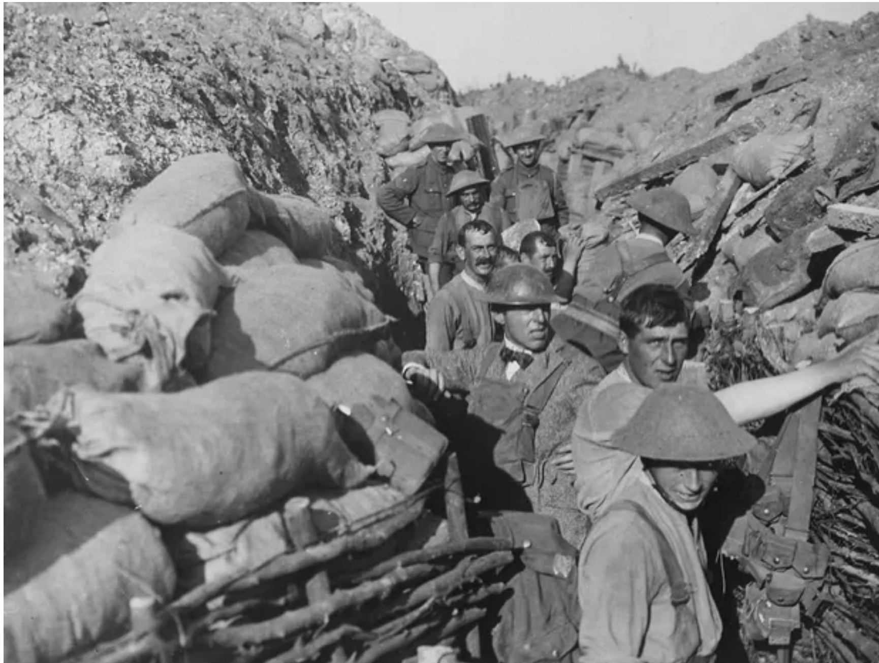
SOLDADOS FAZEM REPARO EM TRINCHEIRA APÓS ATAQUE