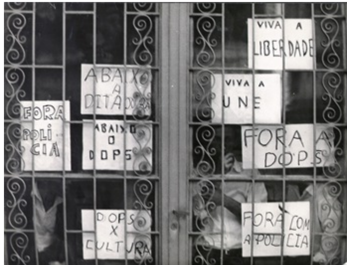
Cartazes estudantis contra a truculência da repressão