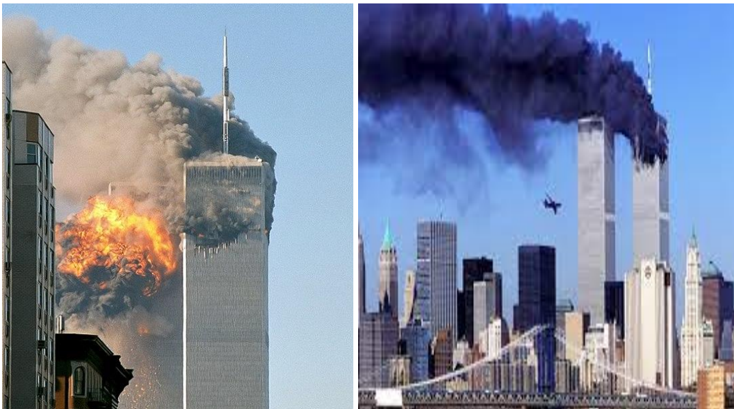
Atentado terrorista às Torres Gêmeas 11 de setembro de 2001, em New York.

O professor deve apresentar as imagens aos alunos: