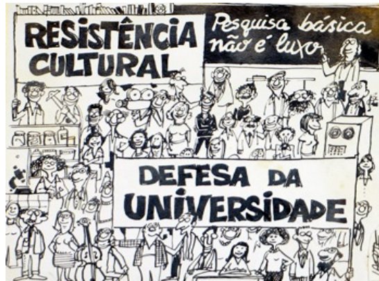
Charge de Laerte