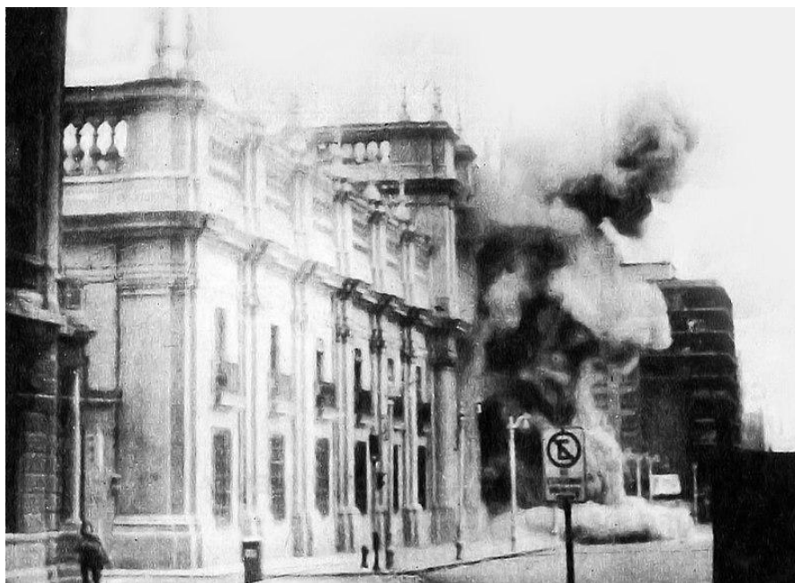
Atentado no dia 11 de setembro de 1973, no Chile.